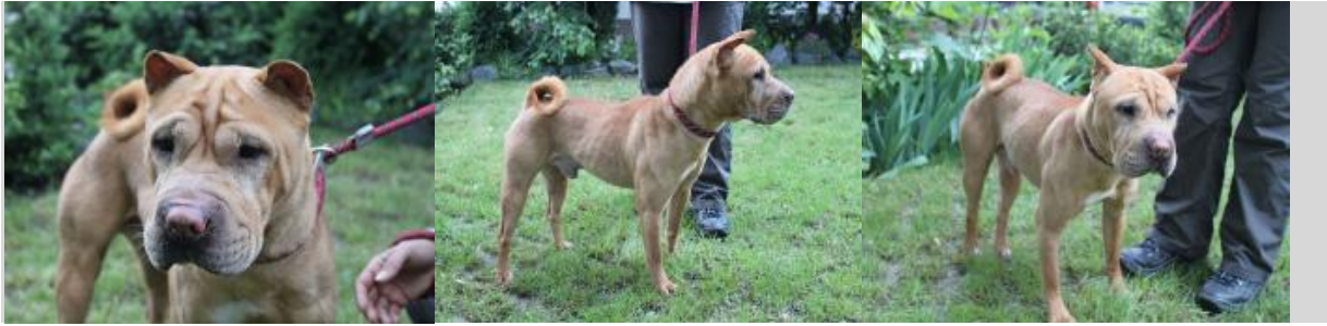
Vic - hellbrauner Shar Pei Rüde * ca. 2000

Vic ist nicht der Typ Hund, der gleich auf Fremde zu rennt, um sie stürmisch zu begrüßen. Nein, ganz Shar Pei typisch schaut er sich erst mal sein Gegenüber an und braucht er ein wenig bis er mit der neuen Person warm wird. Hat er aber jemanden in sein Herz geschlossen, wie hier seine Bezugspersonen und Gassigänger im Tierheim, so ist die Freude groß. Er begrüßt sie überschwänglich, dreht sich vor Freude im Kreis und verschenkt sein liebevolles Wesen. Vom Schmusen kann der anhängliche Rüde einfach gar nicht genug bekommen.